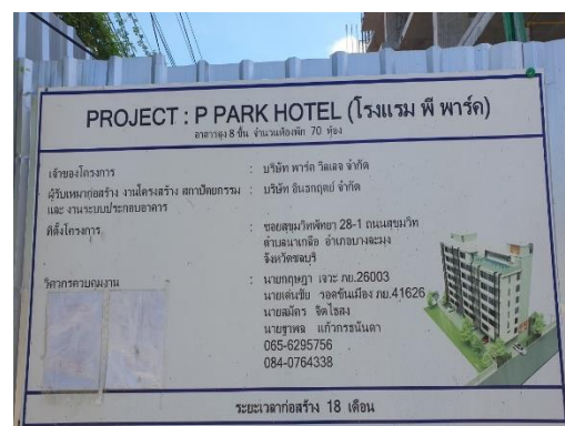
รูปที่ 3-9 ป้ายประชาสัมพันธ์ แสดงรายละเอียดการก่อสร้างโครงการ