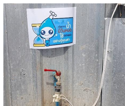
รูปที่ 3-15 ป้ายรณรงค์การใช้น้ำอย่างประหยัด