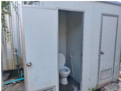
รูปที่ 3-13 ห้องน้ำ-ห้องส้วม สำหรับคนงาน