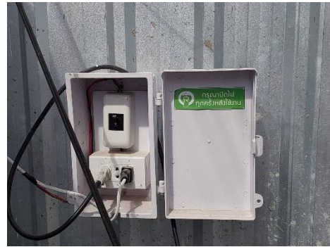
รูปที่ 3-18 ป้ายประชาสัมพันธ์พันธธรรงค์การใช้ไฟฟ้า