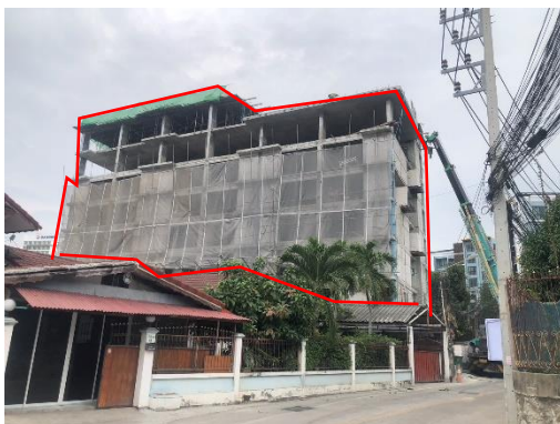
รูปที่ 3-8 ผ้าใบกันป้องกันฝุ่น (Mesh sheet)