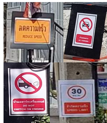
รูปที่ 3-20 สัญลักษณ์ และป้ายเตือน ความปลอดภัยต่างๆ