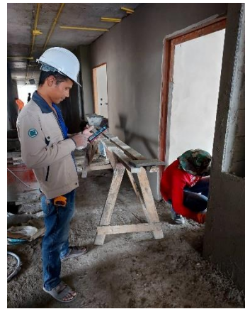
รูปที่ 3-6 เจ้าหน้าที่คอยตรวจสอบการทำงาน และควบคุมการก่อสร้าง