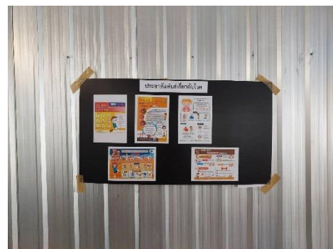
รูปที่ 3-22 ป้ายประชาสัมพันธ์ให้ความรู้ แก่คนงานเกี่ยวกับโรคภัยต่างๆ