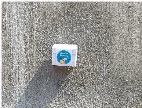
รูปที่ 3-19 กล่องรับเรื่องร้องเรียน