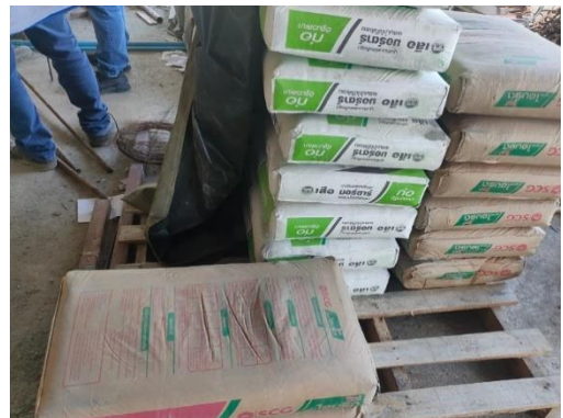
รูปที่ 3-2 การจัดวางอุปกรณ์ก่อสร้างในพื้นที่โครงการ เพื่อความเรียบร้อย