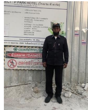
รูปที่ 3-12 เจ้าหน้าที่รักษาความปลอดภัย คอยประสานงานรับเรื่องโครงการ