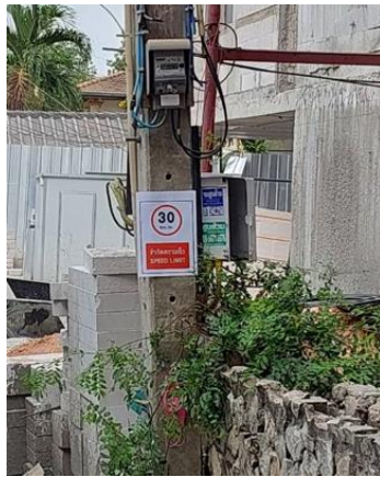
รูปที่ 3-5 ป้ายจำกัดความเร็ว 30 กิโลเมตร/ชั่วโมง