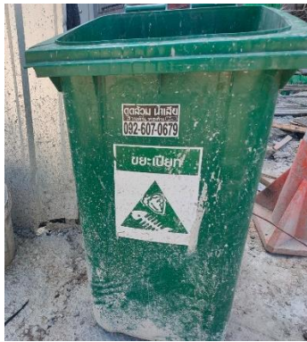
รูปที่ 3-17 ถังรองรับมูลฝอย