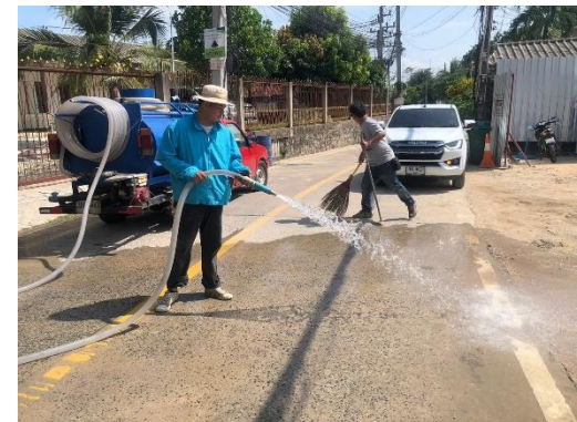
รูปที่ 3-4 เจ้าหน้าที่เก็บกวาดและฉีดพรมน้ำ