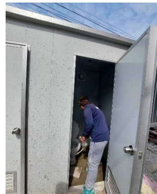
รูปที่ 3-14 เจ้าหน้าที่ดูแลทำความสะอาด ห้องน้ำ-ห้องส้วม