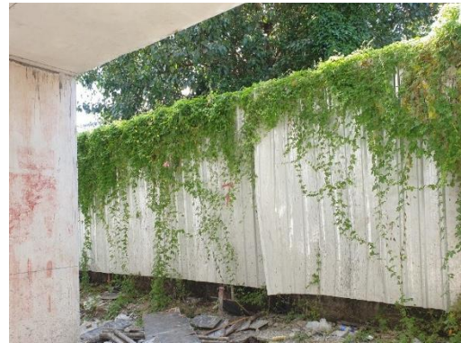
รูปที่ 3-1 แนวเขตที่ดินรั้ว Metal Sheet ความสูง 6 เมตร