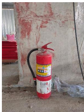
รูปที่ 3-21 ถังดับเพลิง