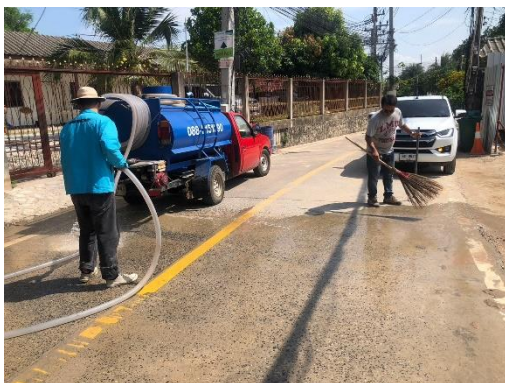
รูปที่ 3-7 พนักงานคอยกวาดเศษดิน และฉีดพรมน้ำบริเวณด้านหน้าโครงการและบริเวณใกล้เคียง