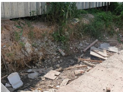
รูปที่ 3-3 เครื่องน้ำชั่วคราว