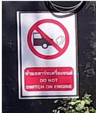
รูปที่ 3-10 ป้ายห้ามติดเครื่องยนต์ขณะไม่ได้ใช้งาน